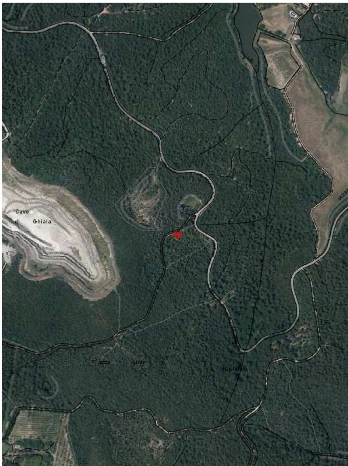
Fascicolo territoriale n. 1 - 2013 Inquadramento generale - Scala 1:10000