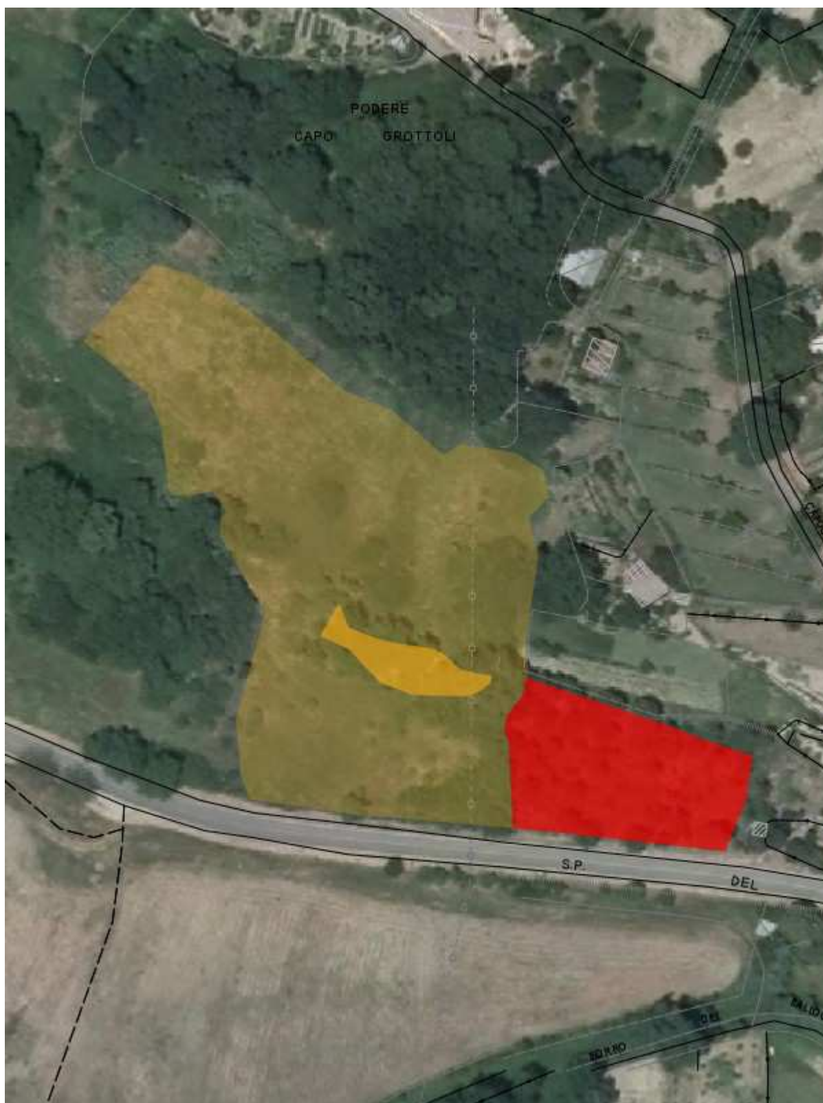
Fascicolo territoriale n. 2 - 2010 Inquadramento su CTR - Scala 1:2000