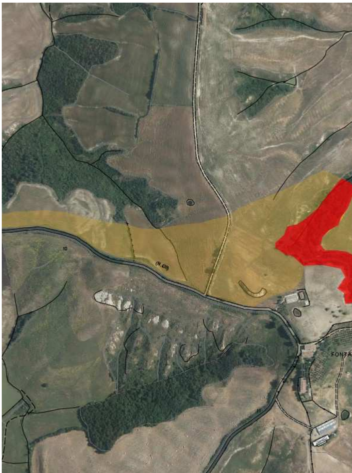
Fascicolo territoriale n. 4 - 2012 Inquadramento su CTR - Scala 1:10000