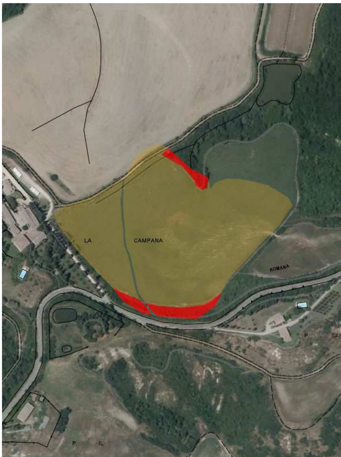
Fascicolo territoriale n. 1 - 2016 Inquadramento su CTR - Scala 1:5000