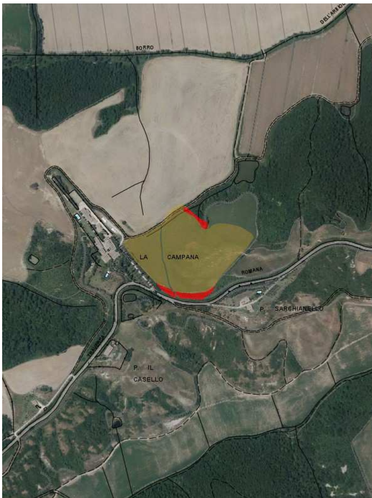
Fascicolo territoriale n. 1 - 2016 Inquadramento generale - Scala 1:10000