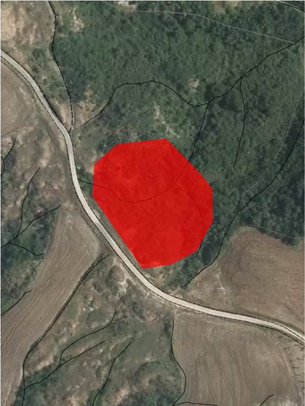
Fascicolo territoriale n. 3 - 2006 Inquadramento su CTR - Scala 1:2000